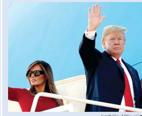
● ترامب يتنقل في جلته الأوروبية

حل وكل الدول ستكون سعيدة.. ويمكن أن تتحول قمة القادة الغربيين جميعاً، إلى خلاف على جديد بعد قمة مجموعة السبع في كندا يونيو الفائت والتي شهدت انضماماً كبيراً». وينظر إلى هذه القمة على أنها الأصعب منذ سنوات، وسط مخاوف أن يصبح ترامب أكثر عدوانية تجاه الحلفاء التاريخي الذي يدعم الأمن الأوروبي منذ 70 عاماً. ومع دعوة مسؤولين ألمان وفرنسيين وأعضاء التحالف لتجاوز خلافاتهم، وجه رئيس الاتحاد الأوروبي دونالد توسك، أمس، رسالة حازمة إلى ترامب عناه فيها إلى «تقدير» حلفائه. وقال توسك: