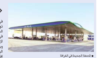
• المحطة الجديدة في الخرافة

في إطار خطتها الاستراتيجية التي تركز على توسيع شبكة محطاتها وخدمة جميع مناطق الدولة، افتتحت قطر للوقود «وقود» محطة جديدة في منطقة الخرافة أمس ليصل عدد محطاتها إلى 76 محطة ثابتة ومتفزة. واليه المهندس سعد راشد المهندي، الرئيس التنفيذي للشركة، قائلاً: «بمبادرة افتتحت محطة وقود الخرافة 2-، لتلبية احتياجات