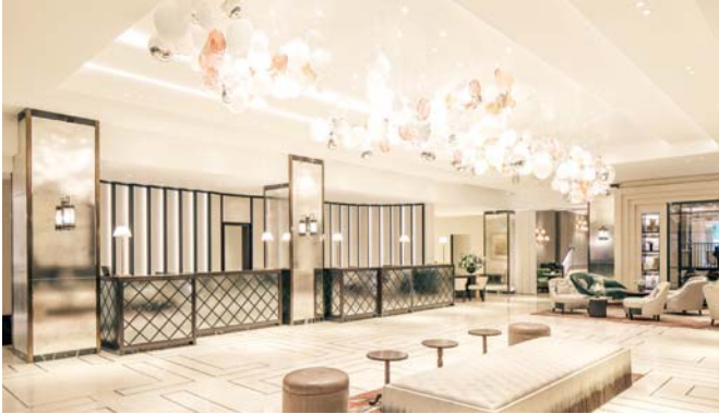
• بيو الفندق

الصفقة جزء من التعهد باستثمار «5» مليارات جنيه في بريطانيا • ثالث صفقة استحواذ في بريطانيا بعد «ذا سافوي» و«أدريا بوتيك»