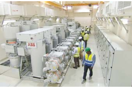
محطة كهرماء في منطقة رأس أبو نفوس 2

المشروع أكثر من 85%، حيث تم تشغيل أربع محطات من أصل خمس، وأكد م. الكواري على التزام المؤسسة بالعمل على استكمال مشاريع