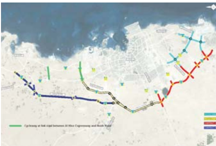
مراحل تنفيذ المشروع وفقاً لخطة المسارات للدراجات البوابة

إلى طريق الشمال .. «أشغال» : إغلاق لمخرج «أم صلال» أسبوعاً